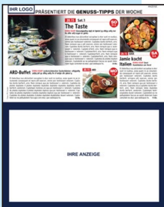
tv Hören und Sehen

Einmal kreiert, mehrfach geschaltet: Den TopCheck können Sie in 6 ausgewählten TV-Magazinen der Bauer Media Group buchen: TV Movie, tv14, tv Hören und Sehen, Fernsehwoche, auf einen Blick, TV klar. Kapazitäten auf Anfrage. Der Preis beläuft sich auf den Preis für eine 1/1-Anzeige des jeweiligen Titels, zzgl. Gestaltungskosten für die Basis Programm auf Anfrage.