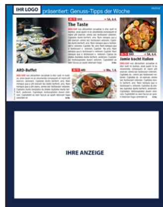
auf einen Blick